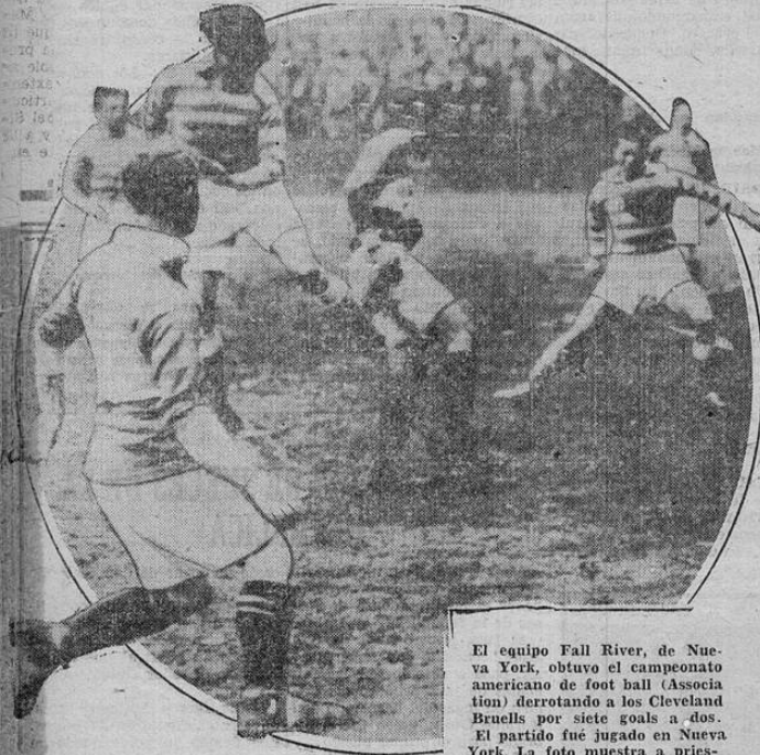
El equipo Fall River, de Nueva York, obtuvo el campeonato americano de foot ball (Asociación) derrotando a los Cleveland Bruells por siete goals a dos. El partido fue jugado en Nueva York. La foto muestra a pries-

los del Fall River, en momentos en que va a lanzar un tiro certero que se anida en la red